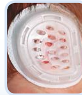
Während der Behandlung